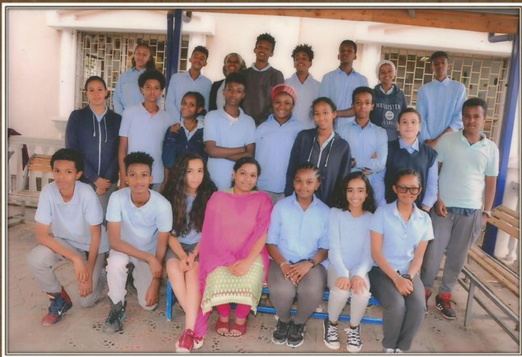
Αιθιοπία 2005 Ορφανά παιδιά που τους παρέιχε τροφή και δίδακτρα μέχρι να ανεξαρτοποιηθούν