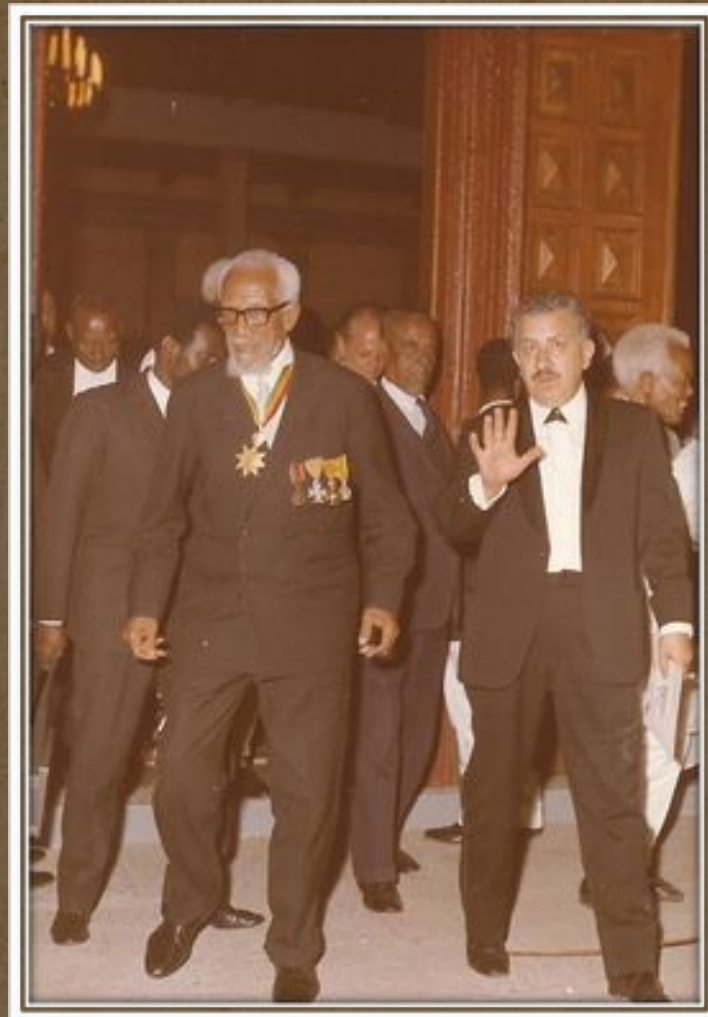
1971-72 Με τον Υπουργό Εμπορίου της Αιθιοπίας