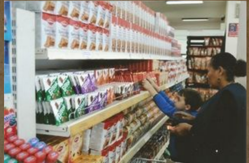
Ο εγγονός του Θανάσης, στο Σούπερ Μάρκετ "Bambis"