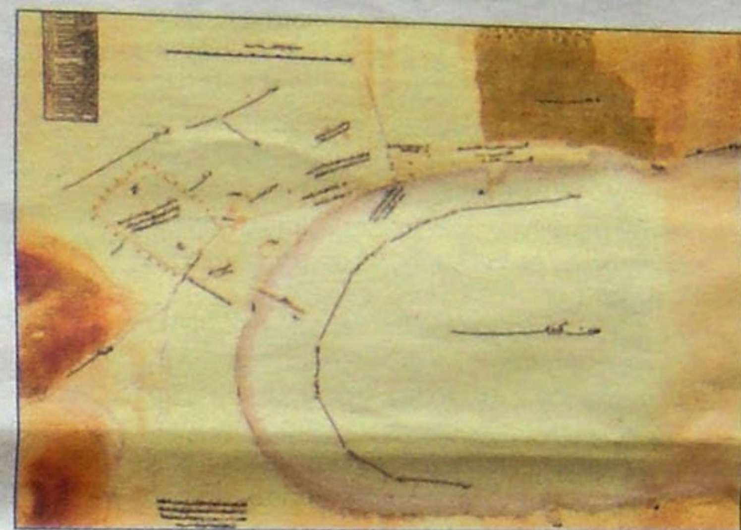
Το πρώτο ρυμοτομικό σχέδιο του Βόλου που χρονολογείται από το 1842