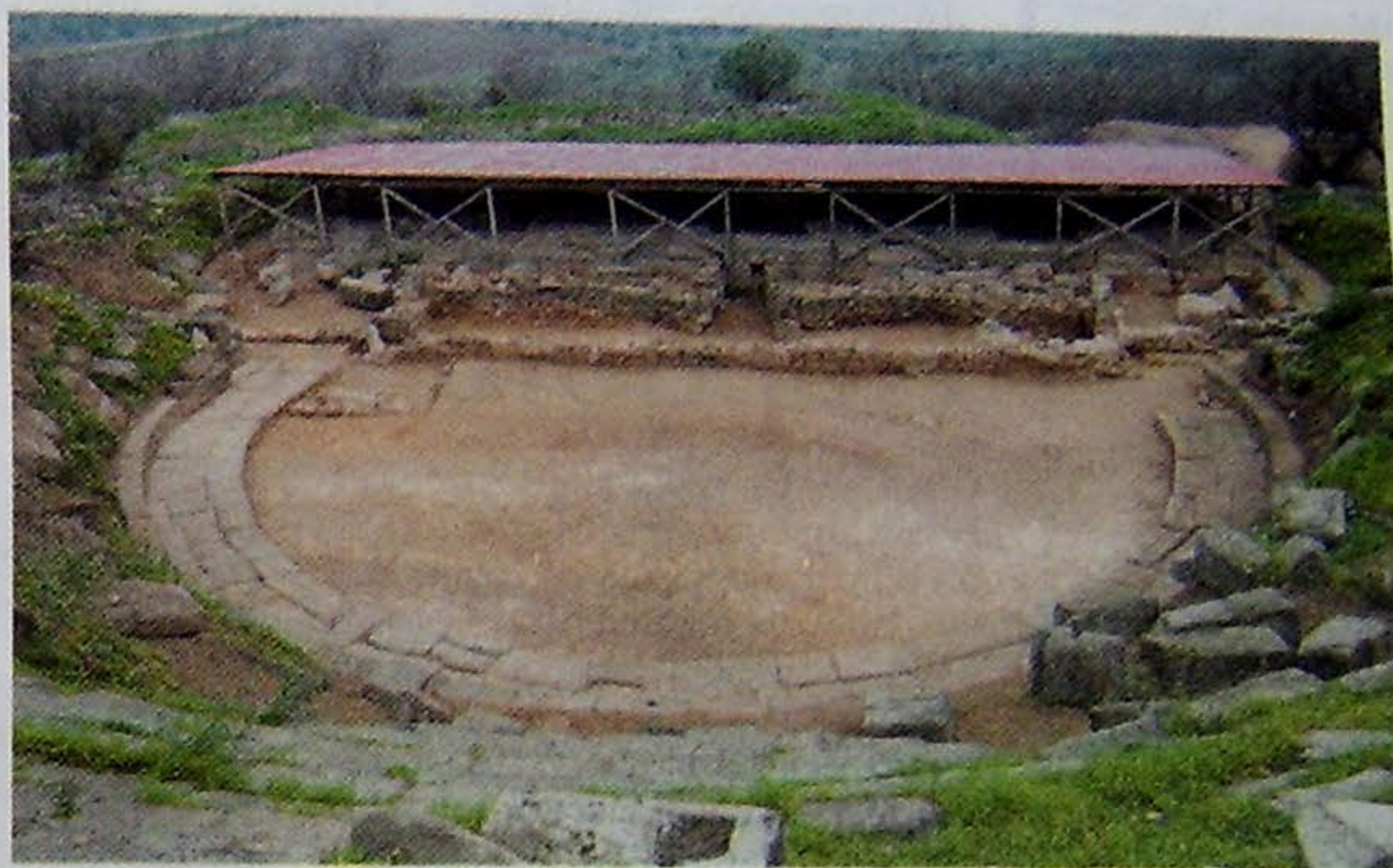
● Το αρχαίο θέατρο Φθιωτίδων Θηβών

Το έθνος των Μαγνήτων μπήκε στον ελλαδικό χώρο από το Βορρά, μαζί με άλλες ελληνόφωνες φυλές, κατά την εποχή της ινδο-ευρωπαϊκής μετανάστευσης (από 2000 π.Χ. και ύστερα). Στην αρχή της ιστορικής περιόδου στην Ελλάδα (περίπου 700 π.Χ.) κατοικούσαν κυρίως στην περιοχή δυτικά της Όσσης, αργότερα κατά μήκος του Αιγαίου, από την Πιερία προς το Νότο. Θεωρούσαν και λάτρευαν το μυθικό Μάγνητα ως γενάρχη και αρχηγέτη τους. Η συγγένειά τους και συνοχή σε διάφορες πτυχές της κοινωνικής ζωής εκδηλώνεται στην ίδρυση (πιθανώς γύρω στα 300 π.Χ.) του Κοινού των Μαγνήτων, η ύπαρξη του οποίου αρχαιολογικά τεκμηριώνεται από το 196 π.Χ. μέχρι και το 222/235 μ.Χ. Από τις αρχαίες πόλεις των Μαγνήτων σώζονται σήμερα υπολείμματα, ιδίως στην "πρωτεύουσά" τους, τη Δημητριάδα. Σήμερα, το Παγκόσμιο Σωματείο Αποδήμων Μαγνήτων είναι αυτόνομο Σωματείο και συνεχίζει τις δραστηριότητές του ανταποκρινόμενο στους ιδρυτικούς σκοπούς, όπως αυτοί περιγράφονται στο Καταστατικό ως εξής: "Η συσπείρωση των αποδήμων της Μαγνησίας με σημείο αναφοράς τον τόπο καταγωγής τους, η ανάδειξη των επιτευγμάτων και της συμμετοχής των αποδήμων Μα-